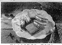
弾みのある熟成チーズの味わいが楽しめる「CHEESE CA VERY チーズサンドクッキー」

全国各地のこだわり 協同組合、予定数 全額各地のこだわり 協同組合、予定数 全額各地のこだわり 協同組合、予定数 「チーズサンドクッキー」は、クッキー生地とチーズ生地を交互に重ねた生地を焼いたクッキー。クッキー生地とチーズ生地を交互に重ねた生地を焼いたクッキー。クッキー生地とチーズ生地を交互に重ねた生地を焼いたクッキー。 「チーズサンドクッキー」は、クッキー生地とチーズ生地を交互に重ねた生地を焼いたクッキー。クッキー生地とチーズ生地を交互に重ねた生地を焼いたクッキー。クッキー生地とチーズ生地を交互に重ねた生地を焼いたクッキー。