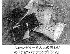
ちよとピターで大人の味わいの「チョコバナナサンドクッキー」

AIでトマトの夾雑物除去 将来的な労働力不足解消 カゴメは、人工知能(AI)を活用し、トマトの夾雑物除去に成功した。将来的な労働力不足解消を目指す。